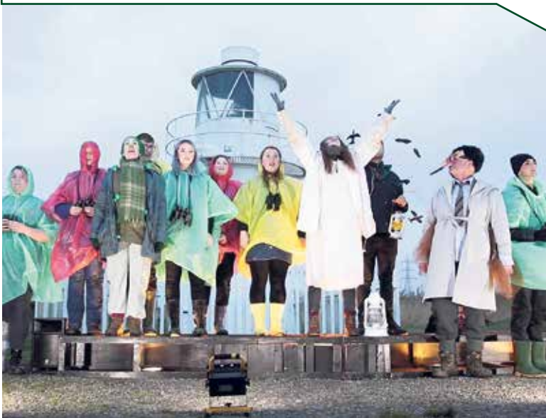
► Cwmni Theatr The Tin Shed yn perfformio Big Skyes