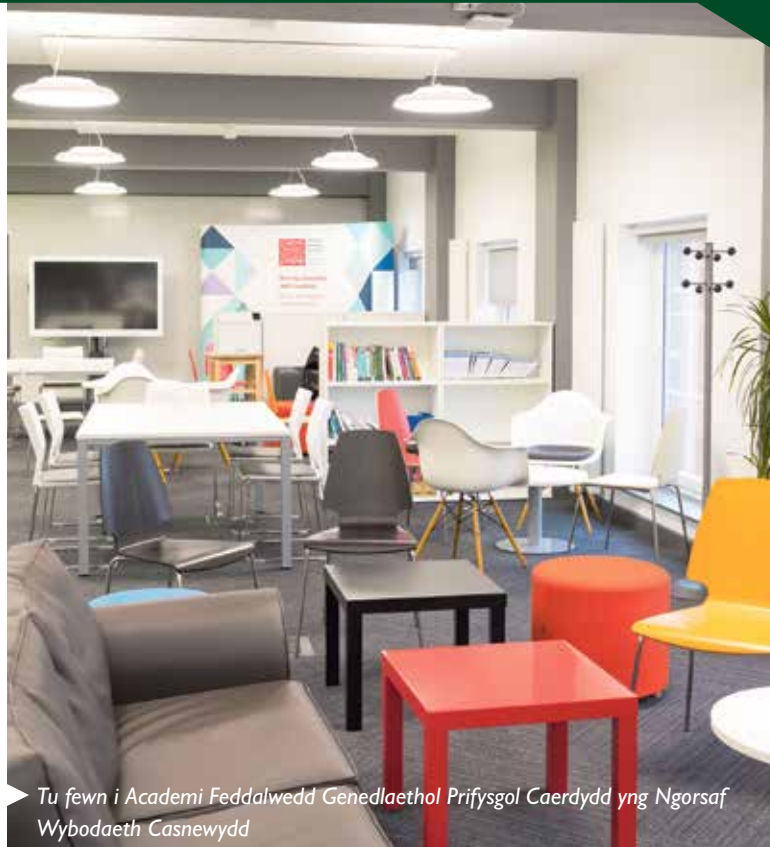
Tu fewn i Academi Feddalwedd Genedlaethol Prifysgol Caerdydd yng Ngorsaf Wybodaeth Casnewydd

Yn ystod y flwyddyn, mae'r Brifysgol wedi gweithio gyda nifer o ysgolion yng Nghasnewydd i sefydlu clybiau codio ac mae'n awyddus i barhau â gwaith yn y gymuned leol yn y dyfodol.