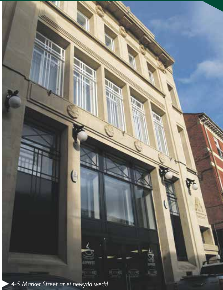
▶ 4-5 Market Street ar ei newydd wedd

Rhoddodd y cyngor gymorth iddynt wrth ddod o hyd i eiddo datblygu addas ac mae'n parhau i weithio'n agos â'r busnes teuluol wrth iddo fynd ati i ehangu ei bresenoldeb yng Nghasnewydd. www.newport.gov.uk/business