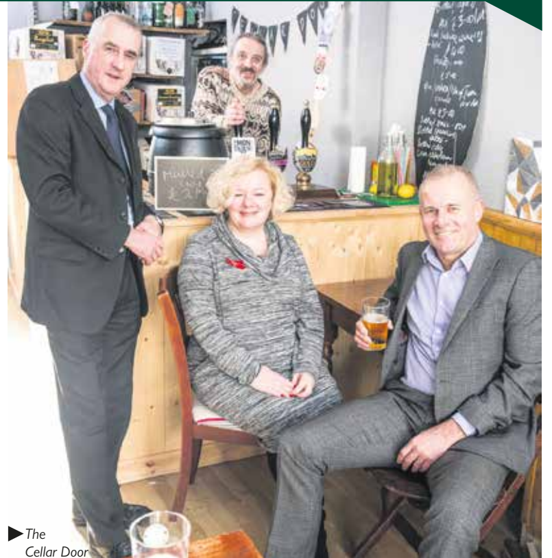
The Cellar Door