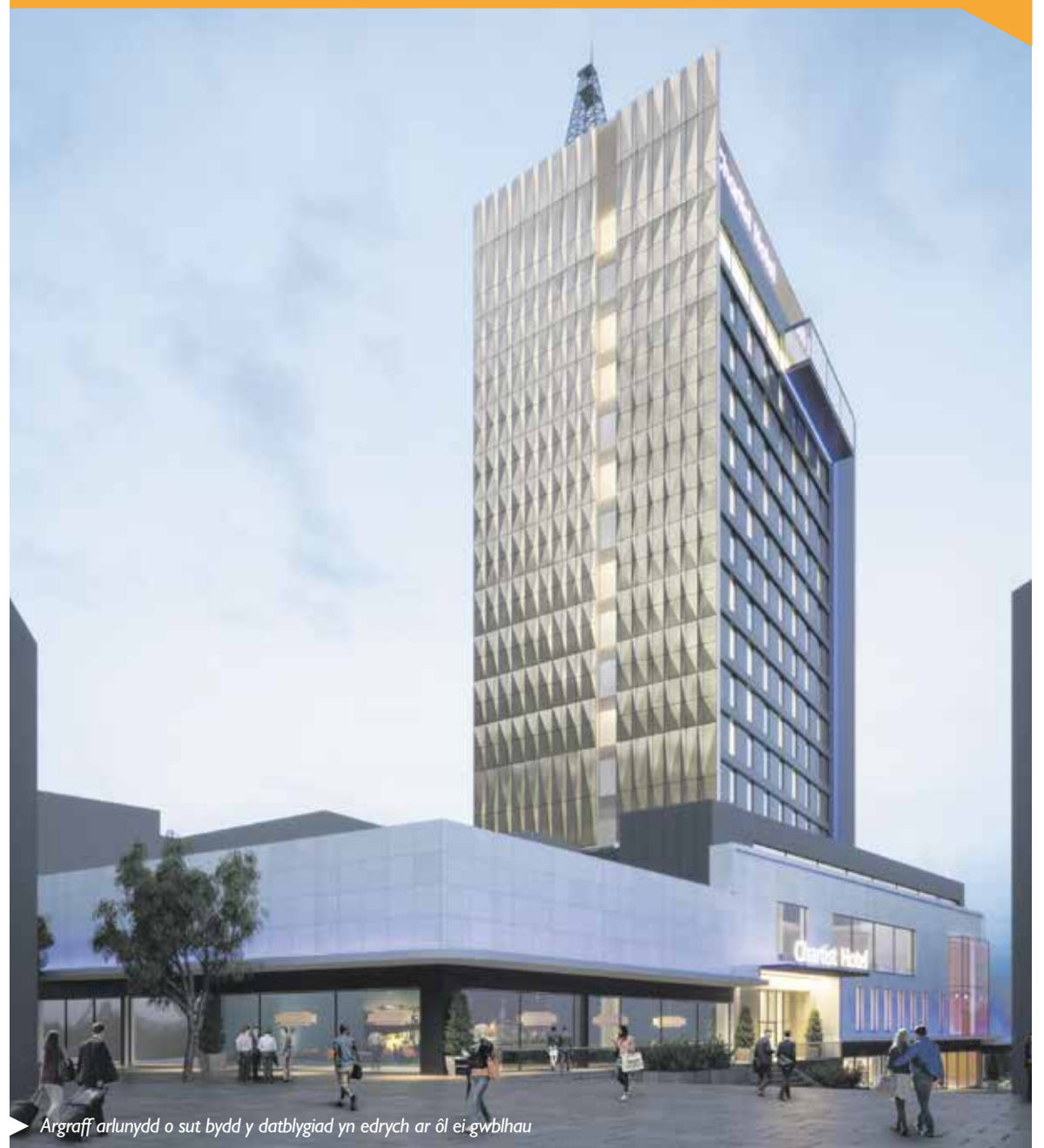
Argraff arlunydd o sut bydd y datblygiad yn edrych ar ôl ei gwblhau