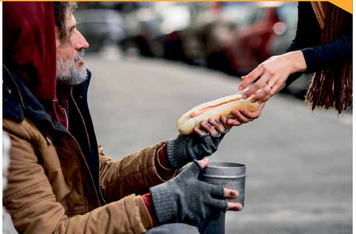
► Llundat ddibenion darluniadol yn unig

ym 1978 ac mae bellach yn gweithredu yn y rhan fwyaf o ardaloedd cyngor yng Nghymru. Mae'n arbenigo mewn darparu gwasanaethau i bobl â sawl angen cymhleth sydd yn aml yn cael eu hallgáu o wasanaethau eraill ac sy'n cael anhawster i ddod o hyd i lety.