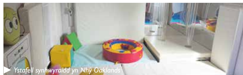
▶ Ystafell synhwyraidd yn Nhŷ Oaklands

"Mae rhieni a gofalwyr yn anhygoel, ond mae angen seibiant byr bob yn hyn y hyn ar y sawl sydd â chyfrifoldebau gofalu. Mae'n hollbwysig bod y plant yn mwynhau eu harhosiad neu eu hymwelid â Thŷ Oakland a bydd y gwelliannau hyn yn gwneud y profiad hyd yn oed yn fwy arbennig."