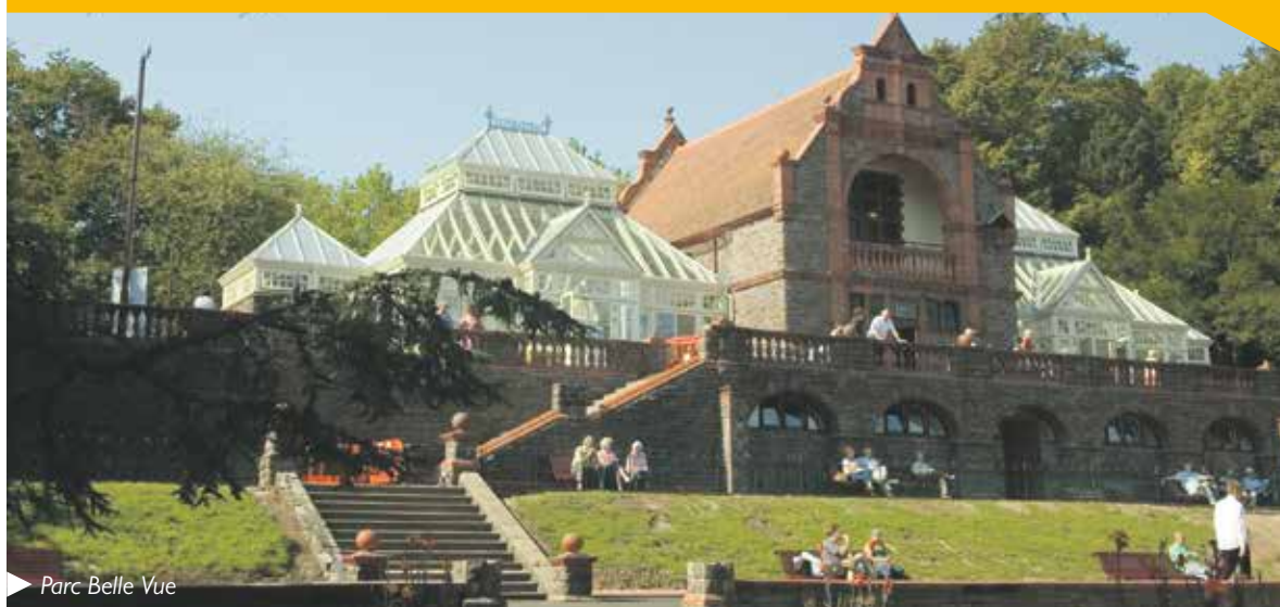
Parc Belle Vue

Cynhelir digwyddiadau a gweithgareddau gwych ledled Casnewydd yr haf hwn/ Dyma ragflas i chi - i gael gwybod am fwy o ddiwyddiadau, ewch i www.newport.gov.uk i weld ein canllaw digwyddiadau.