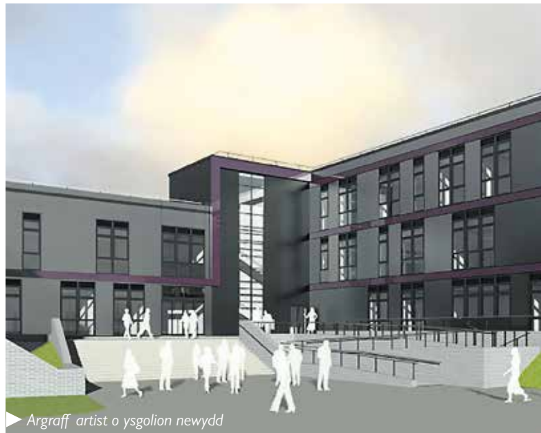
Argraff artist o ysgolion newydd