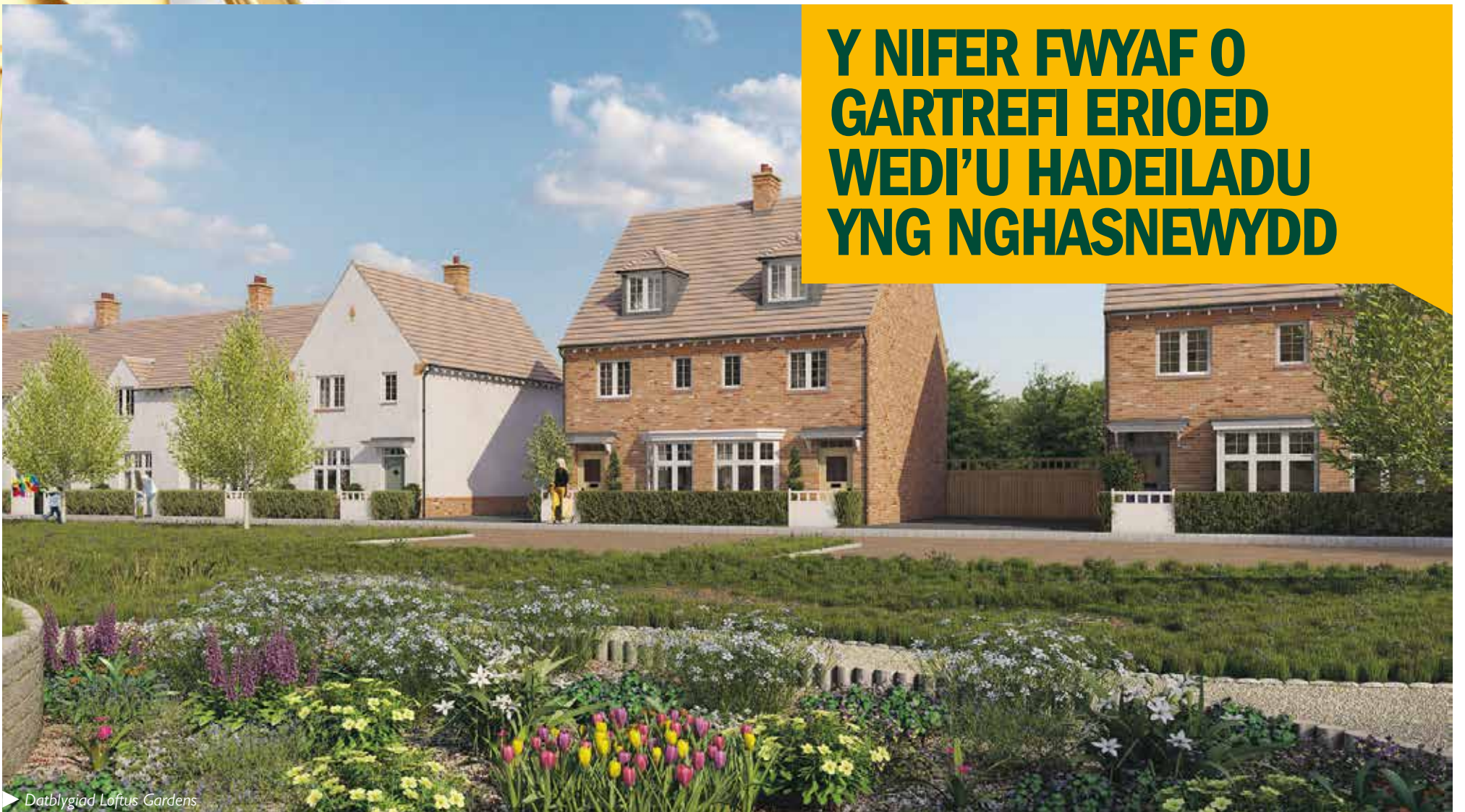
► Datblygiad Loftus Gardens

Adeiladwyd dros 900 o gartrefi newydd yng Nghasnewydd yn 2015/16 - y cyflenwad mwyaf o gartrefi mewn mwy na 25 mlynedd.