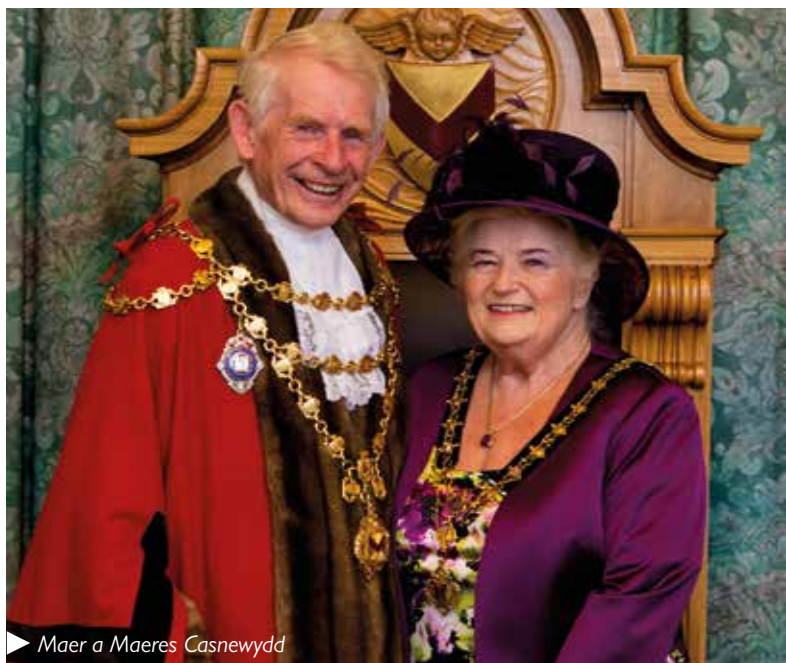
Maer a Maeres Casnewydd

Ceir manylion llawn o bob portffolio yn www.newport.gov.uk